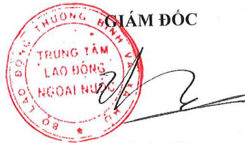
Hà Xuân Tùng